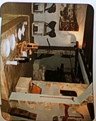
IZLOŽBENI PROSTOR ULJARE