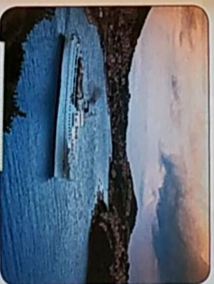
BROD U GRUŽU

Trajekti i drugi putnički i teretni brodovi povezuju luke naše županije s jadranskim i svjetskim lukama. Velika prometna poduzeća su Atlantska plovidba, poduzeće Luka u Pločama i Zrakoplovna luka u Čilipima. Poduzeće Libertas gradski je i prigradski prijevoznik u cijeloj županiji.